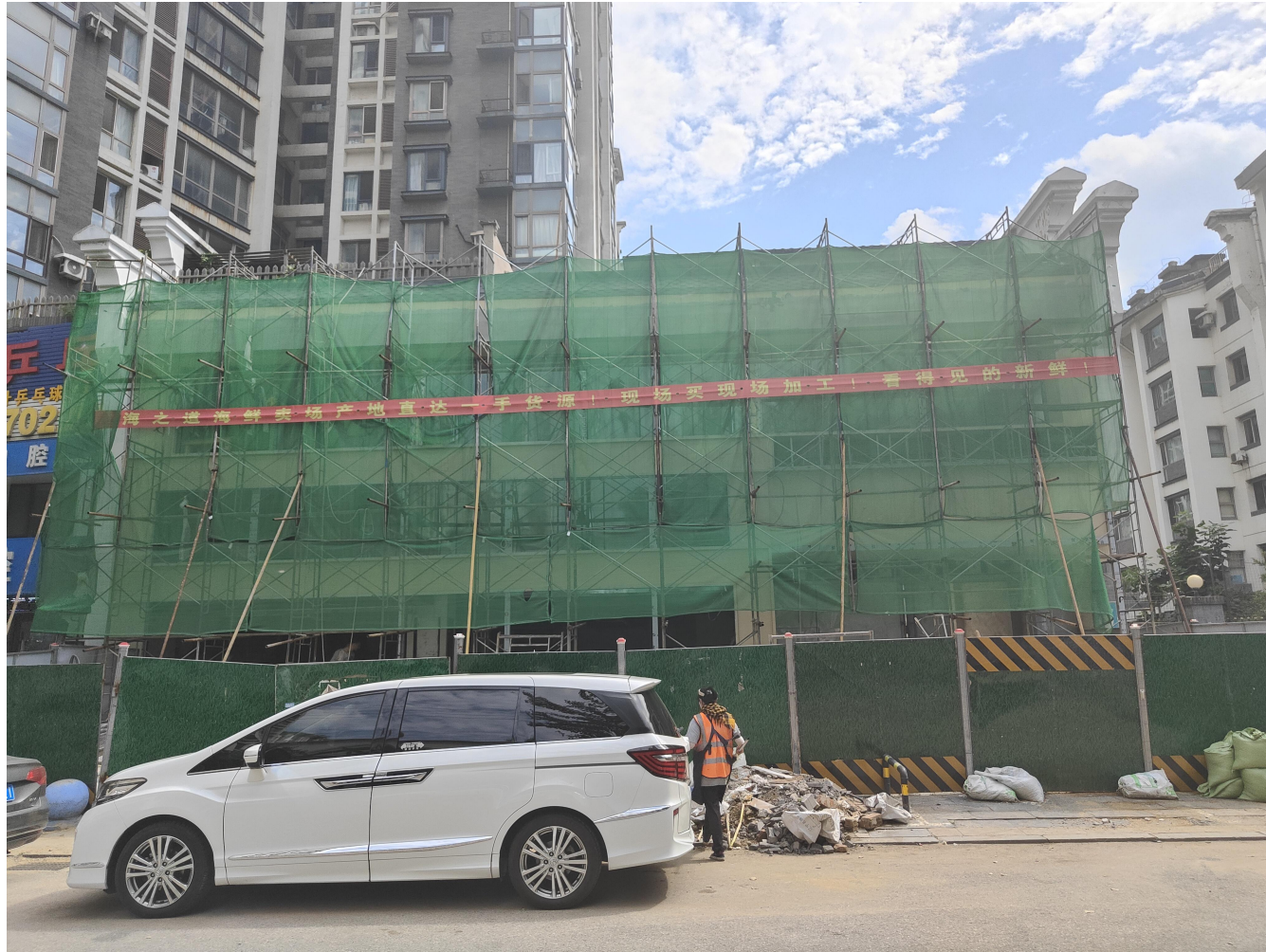
图1 事故发生后的商行外观照片