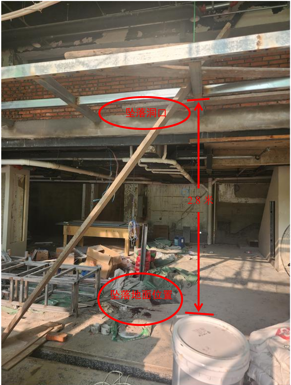
图 4 坠落洞口、坠落地面位置、钢架结构距一楼地面高度