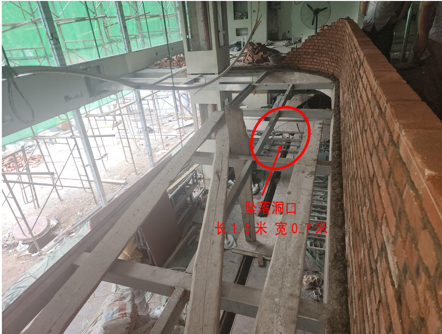
图2 商行二楼钢架结构、跳板、坠落洞口